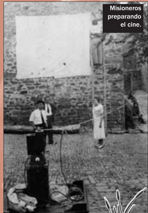
Misioneros preparando el cine.

Hubo otras Misiones Pedagógicas por los pueblos de Cuenca. De hecho la provincia fue una de las más receptoras de esta acción cultural, sobre todo en 1934. En el Campichuelo se actuó en los días 25 a 27 de agosto y el 1 y 2 de septiembre; en Santa Cruz de Moya y Las Rinconadas con maestros que llegan desde Valencia los días 3 a 5 de marzo; en Narboneta y su entrono los días 30 de marzo a 4 de abril; en el Marquesado de Moya entre los días 9 a 14 de julio.